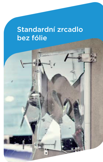
Zkouška rozbití skla - TÜV Rheinland