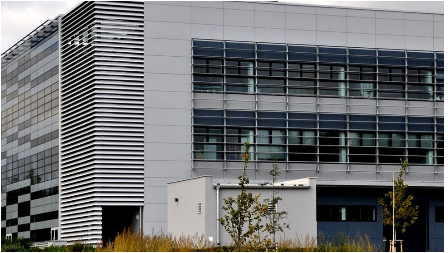
Neutrální protisluneňní sklo - SGG COOL-LITE® SKN