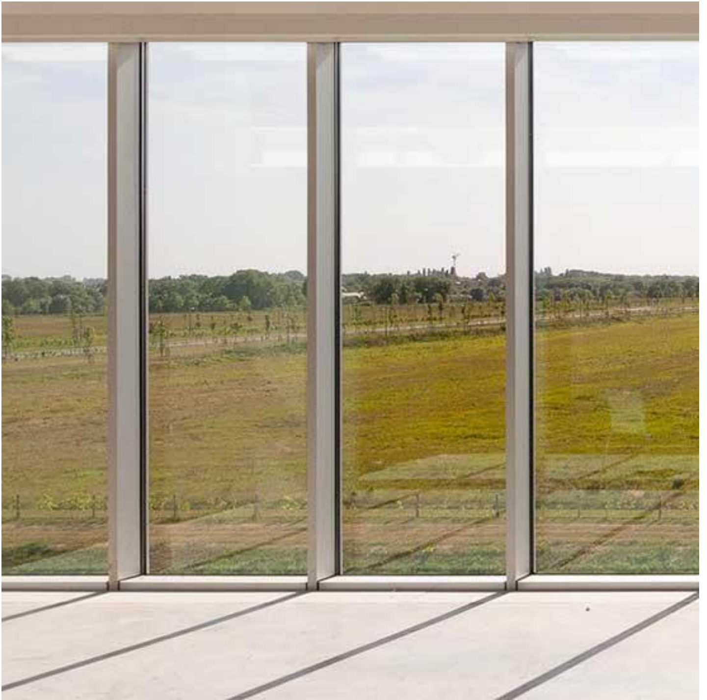
SGG COOL-LITE® XTREME