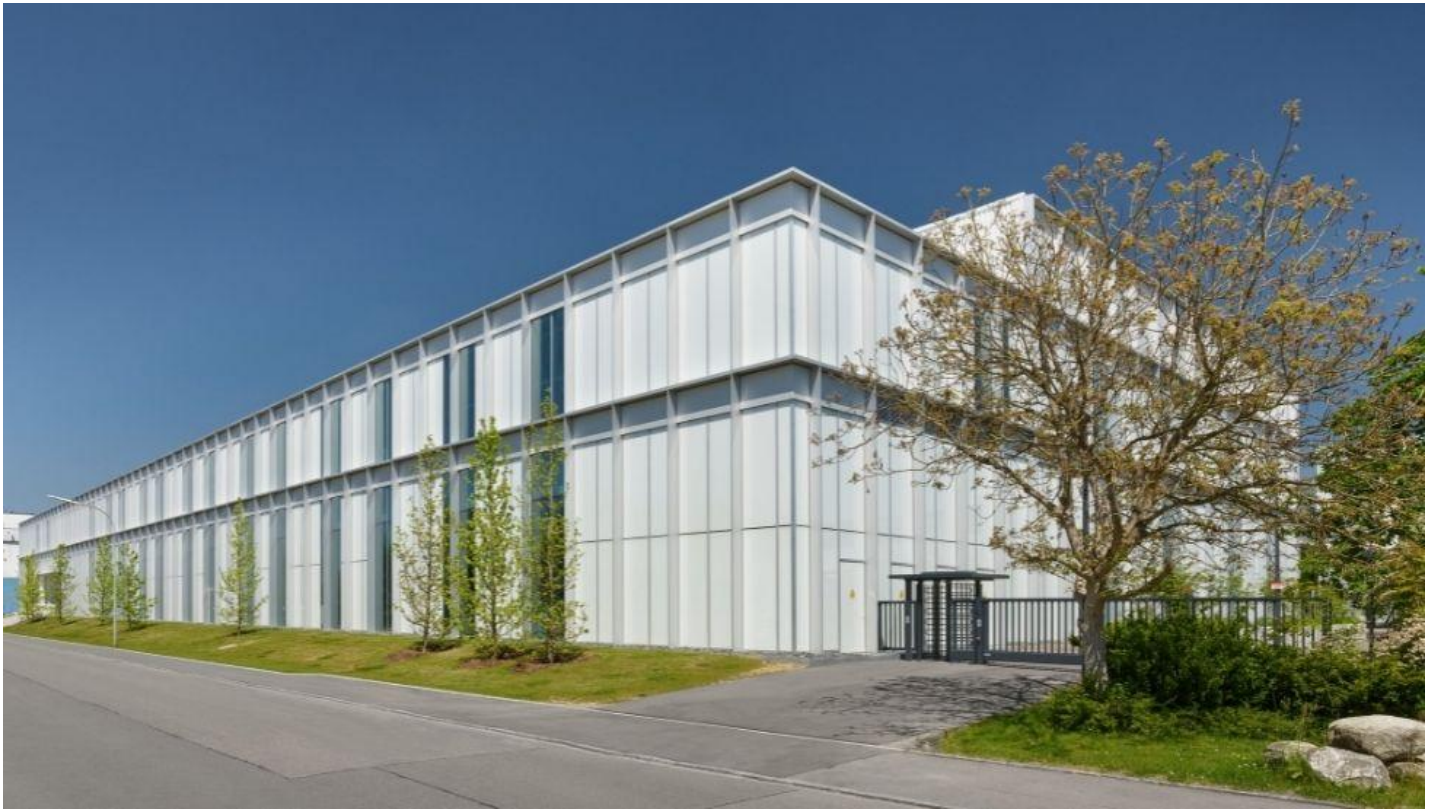
Protisluneňní ochrana - SGG COOL-LITE® SKN