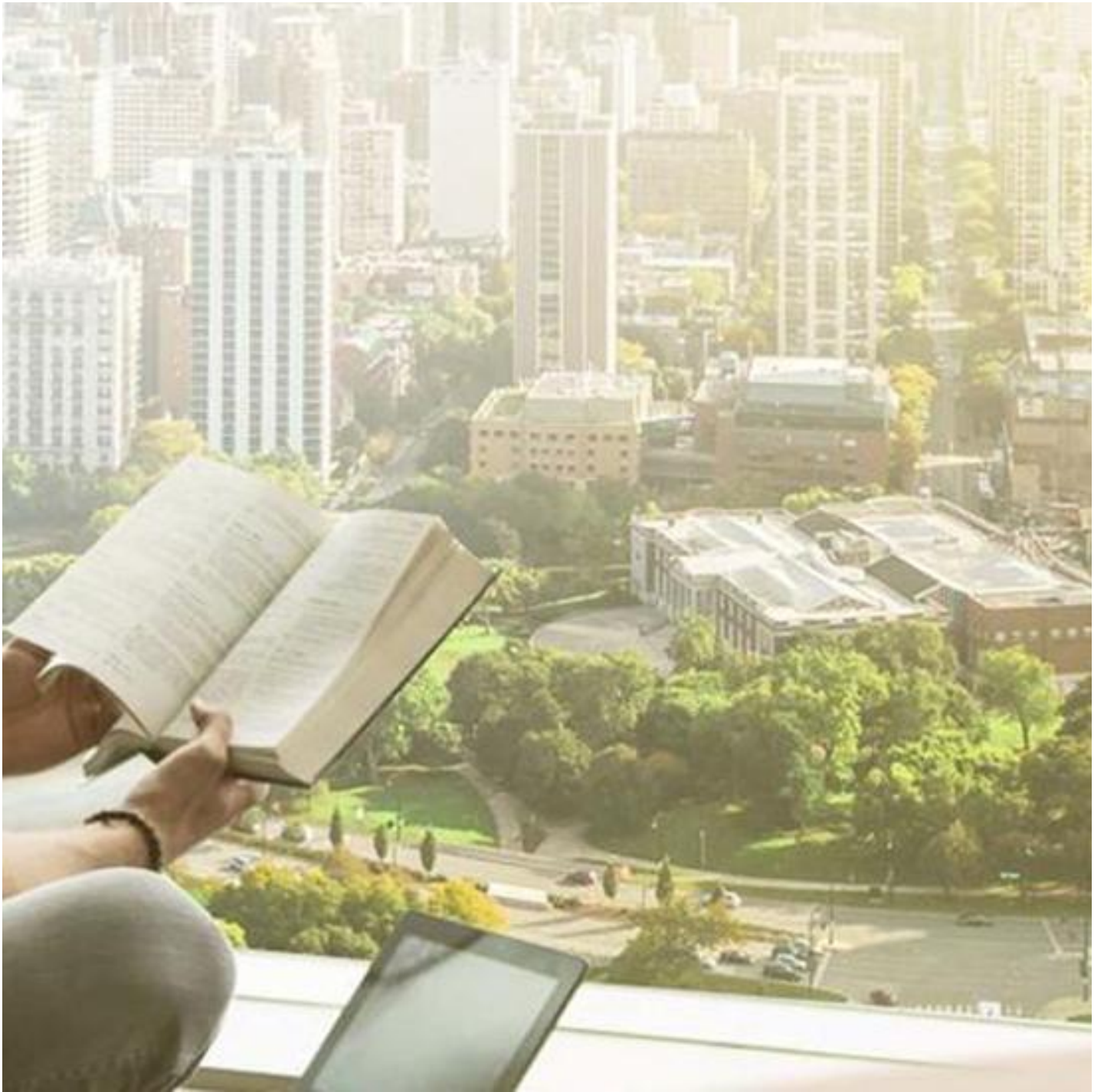
COOL-LITE SKN 183 a SKN 183 (II)