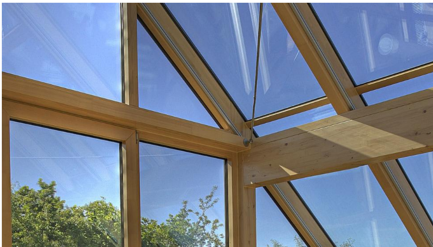
SGG BIOCLEAR samočisticí sklo na terasu