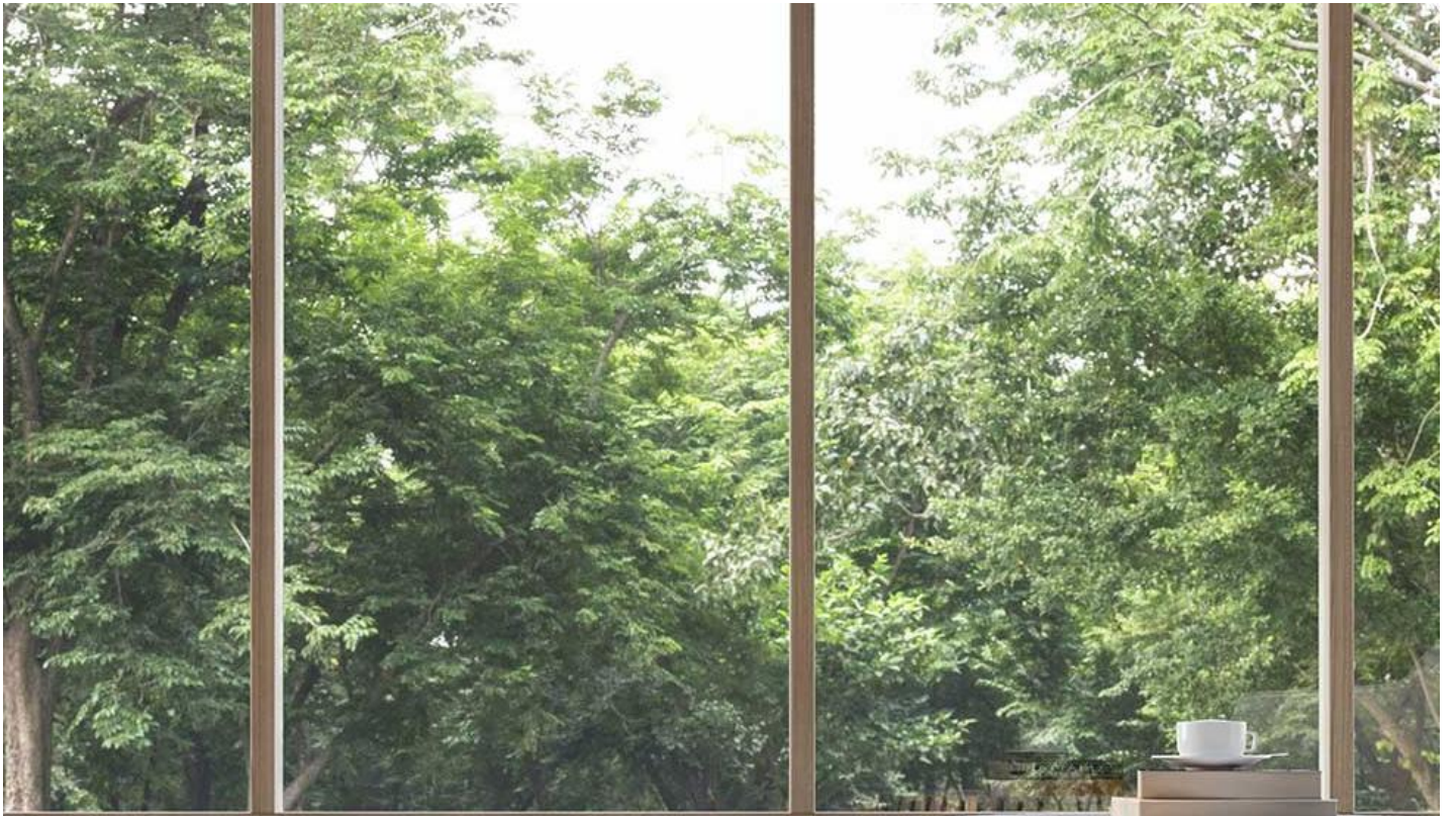
SGG BIOCLEAN Samořisticí řivé sklo