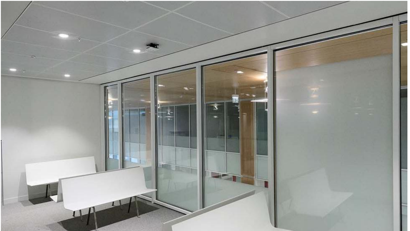
Soudní komplex, Paříž, FRANCIE - akustické sklo