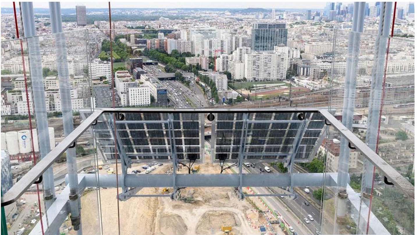
Soudní komplex, Paříž, FRANCIE - sklenené zábradlí