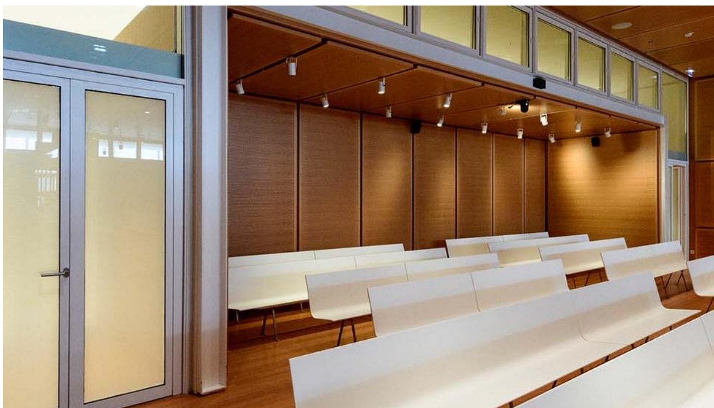
Soudní komplex, Paříž, FRANCIE - SGG CLIMAPLUS