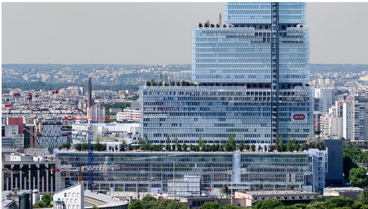
Soudní komplex, Paříž, FRANCIE - COOL-LITE® SKN 054