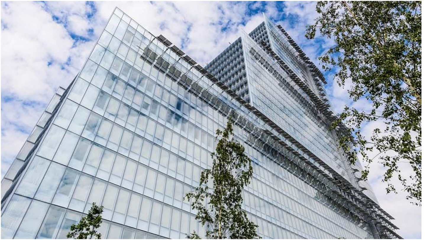
Soudní komplex, Paříž, FRANCIE - COOL-LITE® ST BRIGHT SILVER