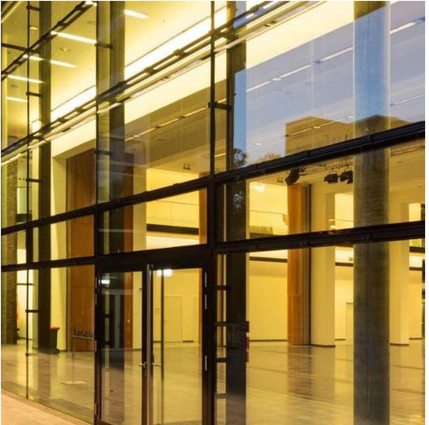
Druhy bezpečnostního skla