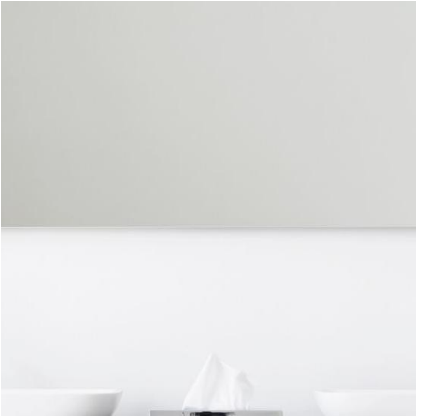
SGG MIRALITE PURE