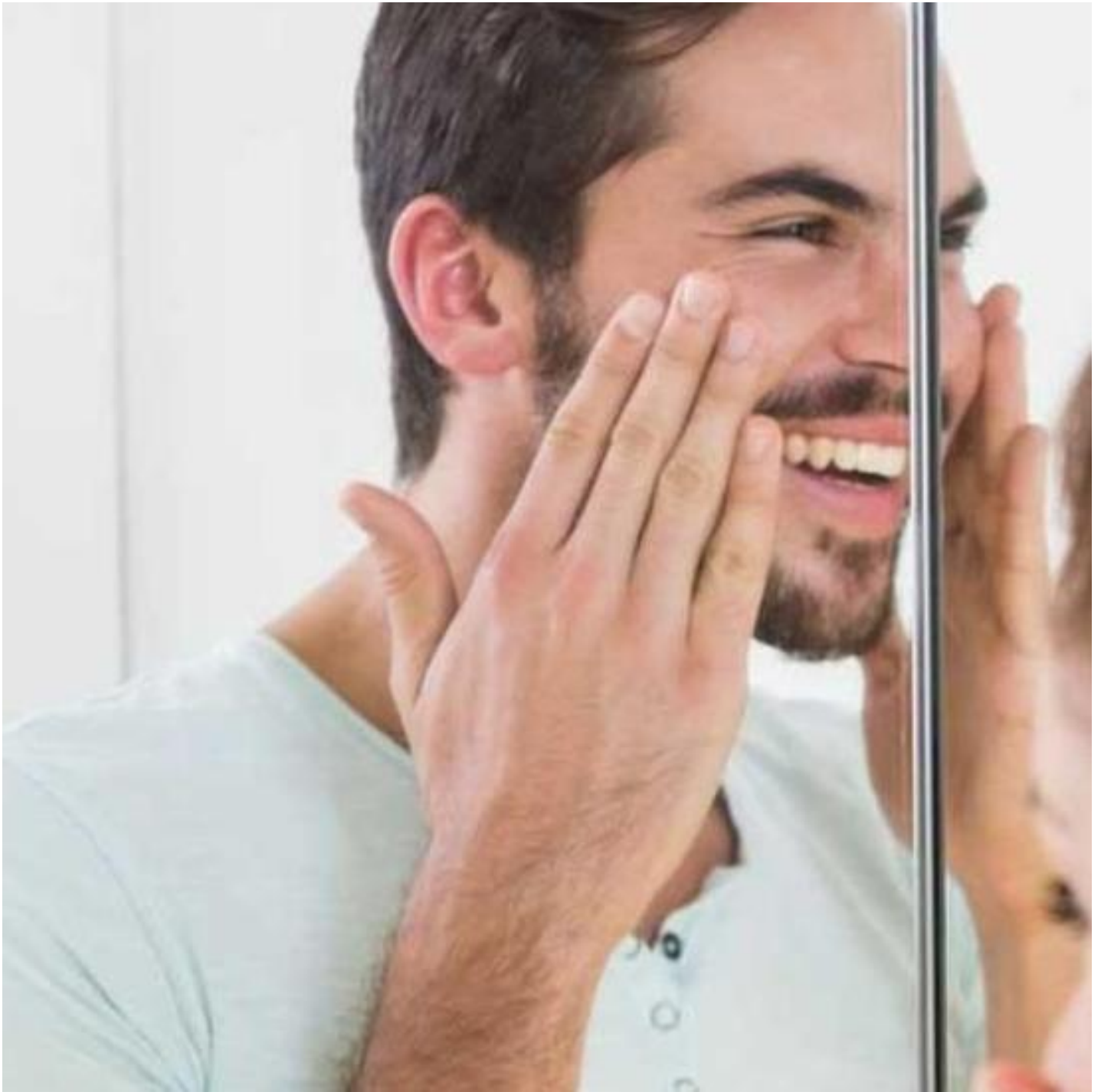
Pro? si vybrat inovativní sklo se zrcadlovým efektem od Saint - Gobain Glass