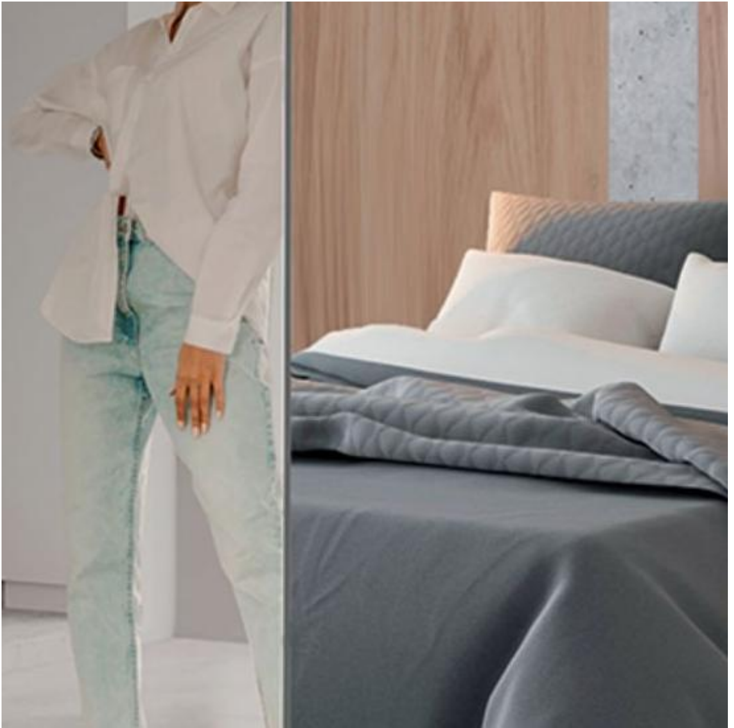
Produktová řada MIRARSTAR®